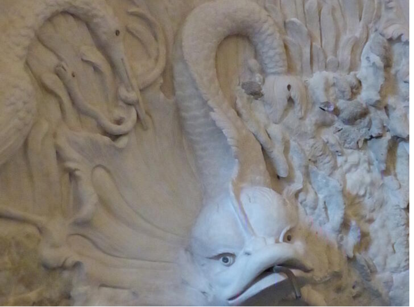
Visite guidée Saint-Antoine au fil du temps - Le temps des bâtisseurs : splendeurs du gothique